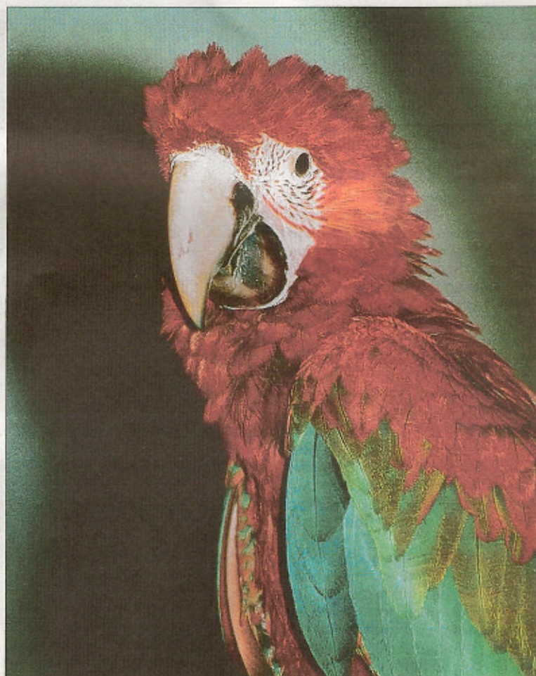
Junger Dunkelroter Ara, erkennbar am hornfarbenen Unterschnabel, in der Freiflugvoliere.

Der Durchschlupf durch ein Tuch in die Freiflugvoliere ist ein Eintritt in eine andere Welt, eine Reise nach Ostafrika in Sursee. Eine wunderbare Bemalung verschafft enorme Raumtiefe. Da ist die ty-