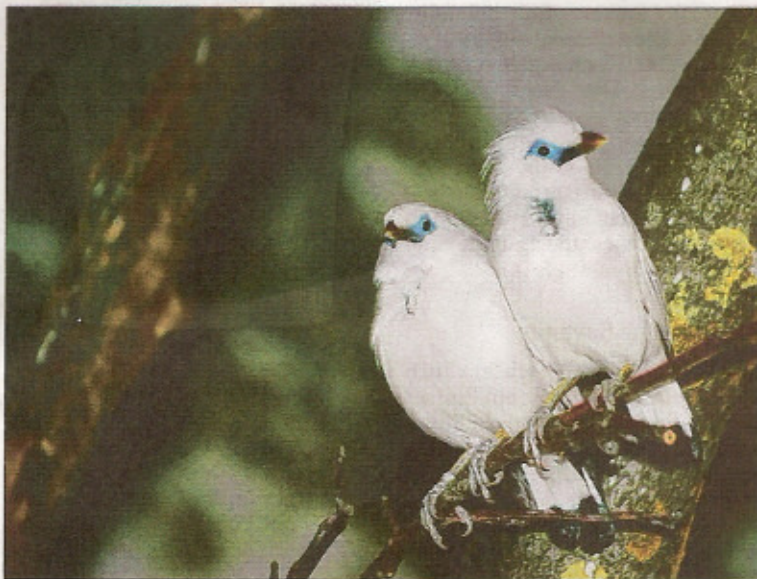
Auch Raritäten wie dieses Paar Balistare gab es in Sursee zu sehen.