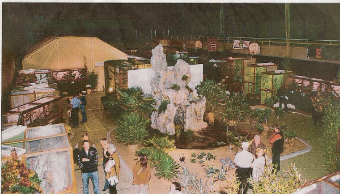
Gesamtansicht der Ausstellung in Sursee mit dem Kunstfelsen und der Freiflughalle hinten links.

sopsitta concinna) und die Blaubürzel-Schönloris ( Charmosyna placensis ornata ). Grünschwanzloris ( Lorius chlorocercus ) waren zutraulich, kamen ans Gitter und streckten ihre Zünglein hindurch. Da konnte man gar die büstenartigen Zungenfortsätze entdecken! Blaukrönchen ( Loriculus galgulus ) vertraten die Fledermauspapageien.