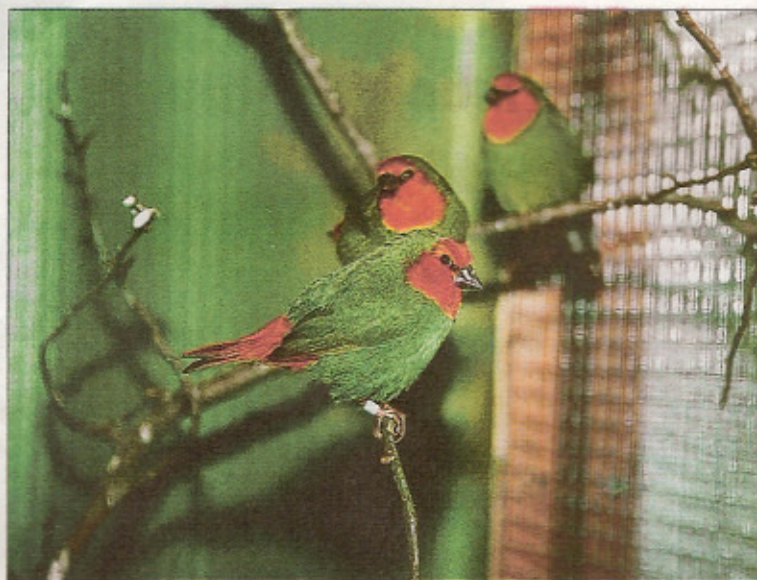
Rotköpfige Papageiamadinen verlangen eine aufmerksame Pflege.

Selten werden heute Loris gehalten, noch seltener ist eine breite Palette dieser Vögel an Ausstellungen zu sehen. In Sursee konnten verschiedene dieser Pinselzungenpapageien bewundert werden. Da waren einmal die Mitchell-Allfarbloris ( Trichoglossus haematodus mitchellii ), die Moschusloris ( Glos-